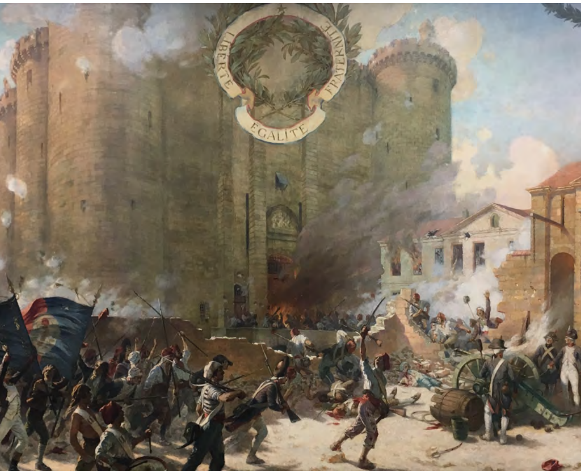
ARMAND SÉGAUD (1823), TOILE